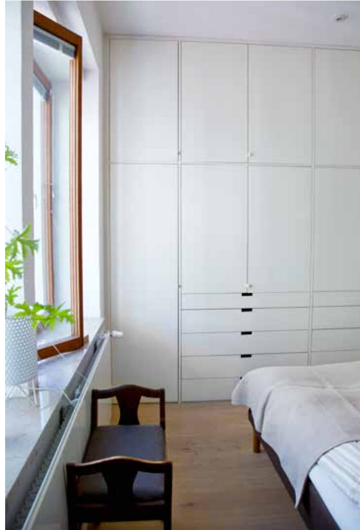
REJÄLT MED FÖRVARING. Sovrummet bytte plats med det tidigare köket och fick en garderobsvägg av en prototyp i Norrgavels produktutveckling.