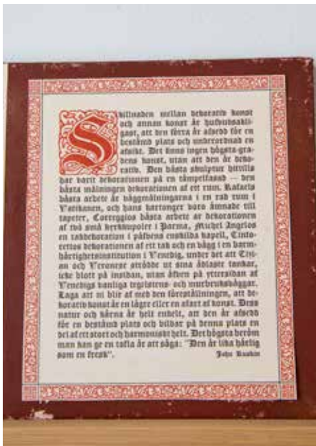
KONSTHISTORIA. Ett provtryck från 1913 om skillnaden mellan konst och formgivning av den engelske konstkritikern och författaren John Ruskin, en gåva från en nära vän.

► Framför de franska balkongdörrarna finns det gott om plats att utöva yoga. De har regelbundet meditationsträffar i rummet, då flyttar de ut möblerna till köket på mindre än tio minuter. Meditationskuddar och en Buddhastaty skänker rummet en sakral känsla.