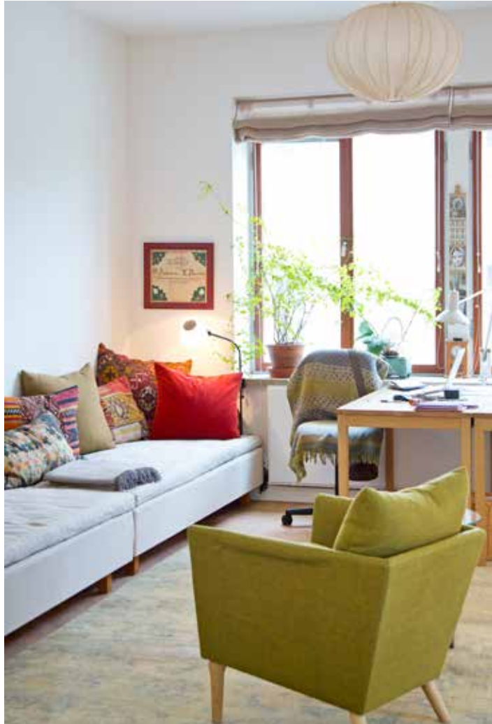
FUNKTIONELLT. Arpita som är terapeut tar emot klienter i arbetsrummet. Hennes kontorsstol har kamouflerats med en vacker filt så att den lättare smälter in i rummets estetik.